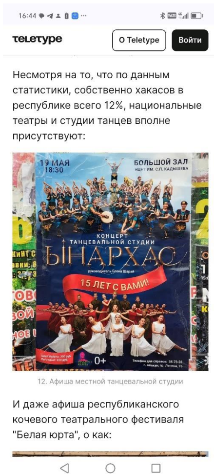
12. Афиша местной танцевальной студии

афиша республиканского кочевого театрального фестиваля "Белая юрта", о как: (Рис. 2) [Абакан – Teletype]